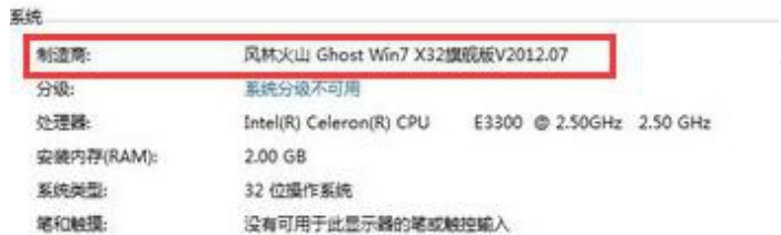
盗版Windows 7 示例