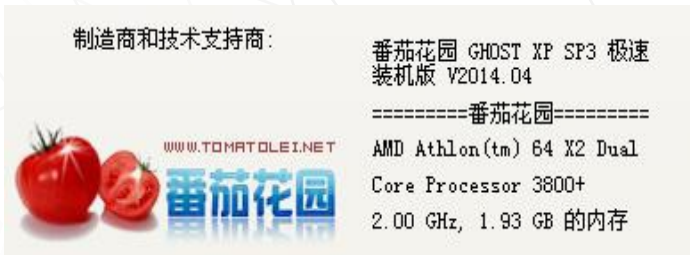
盗版Windows XP 示例